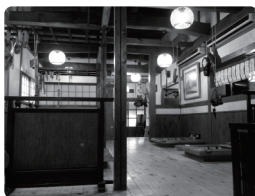
地鶏料理屋さんの料理（左）と店内（右）